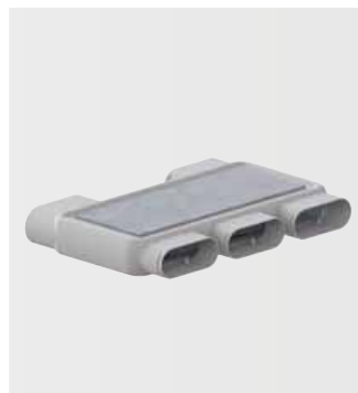
Rozvaděč flat 51, 4-násobný, s jedno- duchým napojením

Tam, kde nelze použít pevné díly, umožní ohebný prvek výšková uskočení a různé ohyby.