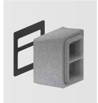
ComfoPipe Plus Připojovací box

V jednom stavebním dílu s průřezem 200 x 330 mm je veden venkovní i odvětrávaný vzduch. Potrubí zajišťuje jejich neprodyšné oddělení. Tepelně-izolační parametry potrubí splňují i požadavky náročné normy DIN 1946-6. Fixační spony slouží k upevnění stěnového zakrytí (např. sádkkartonu).