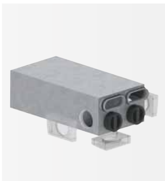
Kombinace akus- tického tlumiče/ rozdělovače

V různých provedeních, svislém nebo vodorovném, slouží k propojení mezi větrací jednotkou, akustickým tlumičem nebo dvojitým vzduchovým potrubím. Umožňuje napojení při minimálních prostorových nárocích.