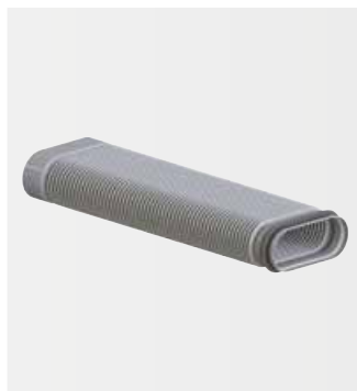
CK 300 Ohebný prvek

Akustický tlumič je opatřen speciálním tlumícím jádrem. Díky tomuto vysoce účinnému akustickému tlumení jsou eliminovány veškeré zvuky v potrubí přiváděného a odváděného vzduchu. Prvek navíc umožňuje přímé napojení vedlejších prostor a ventilů.