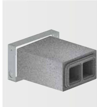
ComfoPipe Plus Dvojté potrubí & fixační spony

Venkovní a odvětrávaný vzduch je veden jen jedním instalačním prvkem, harmonicky včleněným do fasády. Díky promyšlené konstrukci je recirkulace odvětrávaného vzduchu zpět do objektu téměř vyloučena.