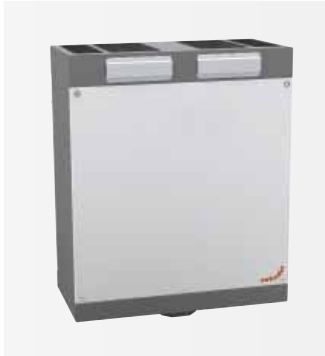
Zehnder ComfoAir 180

Kompaktní větrací jednotka se pohodlně vejde do standardní kuchyňské skříňky či do niky. Pro rozvody vzduchu není třeba snižovat podhledy v celém bytu. Tak zůstane bytová plocha a pocit volného prostoru zachován.