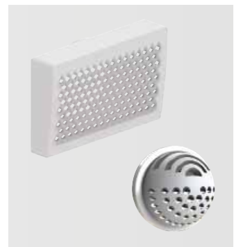
Renoventily pro přiváděný i odváděný vzduch

Namísto původních dvou je nyní rozdělovač napojen pouze jedním potrubím CK 300. Díky úspoře místa mohou být například i v chodbě šířky jen 110 cm osazeny pod stropem rozdělovače přiváděného i odváděného vzduchu vedle sebe.