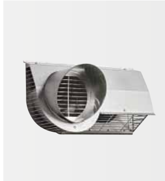
Kombinovaná mřížka na vnější stěnu

Kompaktní větrací jednotka se pohodlně vejde do standardní kuchyňské skříňky či do niky. Pro rozvody vzduchu není třeba snižovat podhledy v celém bytu. Tak zůstane bytová plocha a pocit volného prostoru zachován.